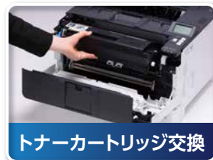
トナーカートリッジ交換