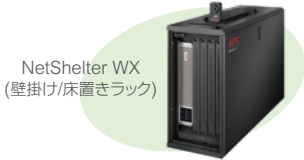
NetShelter WX (壁掛け/床置きラック)