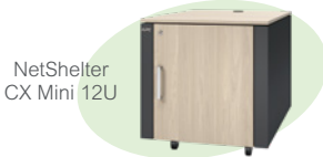
NetShelter CX Mini 12U

静音効果のあるNetShelter CX Mini 12Uにサーバーやネットワークを収容し、周囲の環境に配慮したエッジ環境を構築できます。