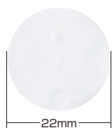
表 500円玉とほぼ同じサイズ