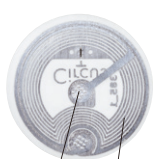
裏 ICチップ アンテナ