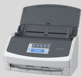
イメージスキャナー ScanSnap iX1600 オープン価格