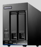
LinuxOS法人向けNAS HDL2-XABシリーズ ¥89,100～（税込）