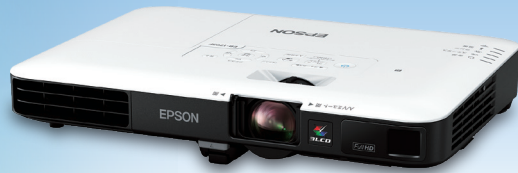
*画像はEB-1795Fです。(注)95~21年実績 1000lm以上のプロジェクター国内販売台数において、富士カメラ総研調べ。