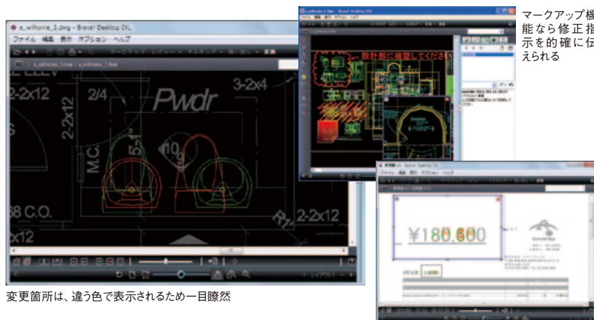
変更箇所は、違う色で表示されるため一目瞭然