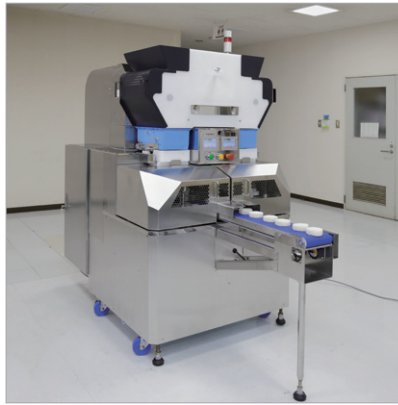
おにぎりを製造する不二精機の小型成形機。1 時間に最大 7000 個製造する能力を持ち、コンビニエンスチェーンの食品工場などで利用されている。

Vault では設計者が図面をサーバーからチェックアウトすることで、その図面を編集できるようになる。編集を終えてチェックインで書き戻すまで、他の設計者は図面を編集できない。最新バージョンの図面がいくつもあるような事態を防げるわけだ。「データ管理を担当者任せにすると、その担当者が海外出張や休暇などで不在の際に仕事が滞り、手配が遅れるようなことにもなりかねません。Vault を使うことで他の設計者にもデータの状況が分かるようになり、チーム全体の対応力など開発業務全体の効率が上がりました」と伊藤氏は言う。