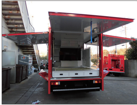
「防災指揮車」は開閉部分などの可動部分が多い。