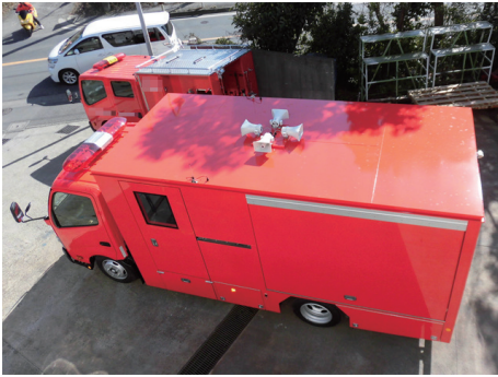
野口自動車で手がけた「防災指揮車」の一例。火災や災害の現場で、活動の指揮を行ったり、調査を行うための車両だ。この車両では、天井部分に拡声器を設置。