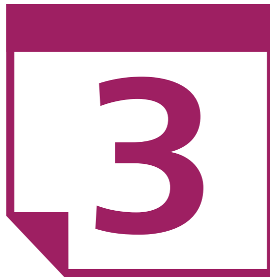
四半期ごとの Desktop Subscription