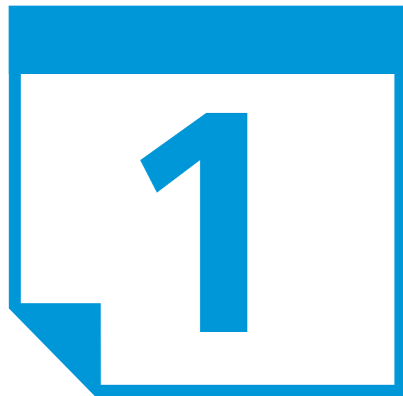
月々の Desktop Subscription

お客様は、1 ヶ月、3 ヶ月、1 年間の単位で Desktop Subscription をご購入いただけます。このような柔軟な期間を提供することで、お客様の側で変化する予算、増員計画、プロジェクトのニーズに対応することができます。