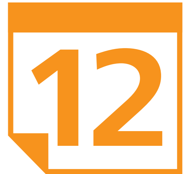
年間の Desktop Subscription